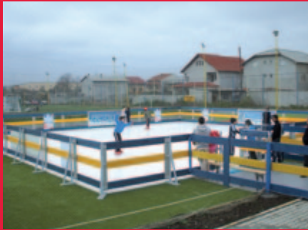
Freizeiteisbahn in Rumänien