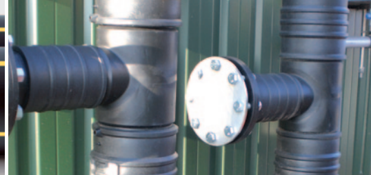
v.l.n.r.: SIMONA® PE 100 Rohre am Fermenter; SIMONA® PE 100 Gasrohre; SIMONA® PE 100 Formteile installiert an der Behälterwand